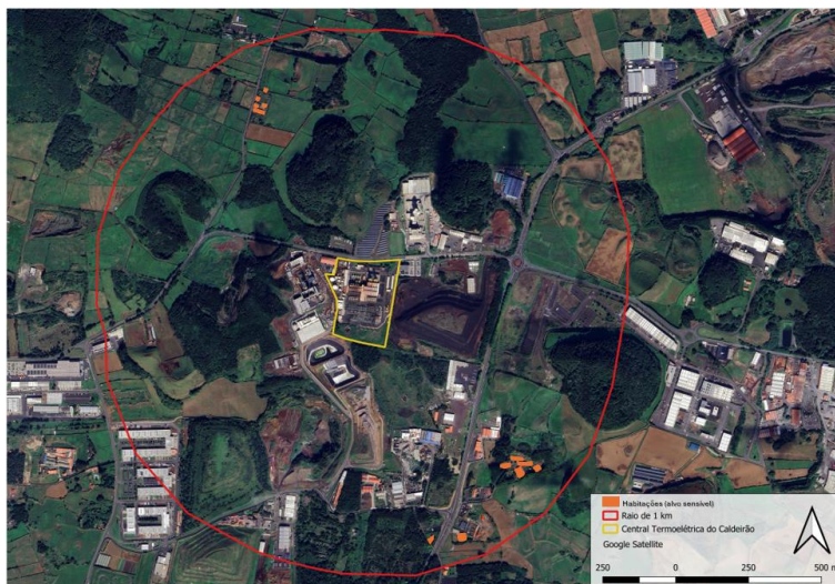
Figura 3 – Localização das habitações mais próximas da CTCaldeirão.