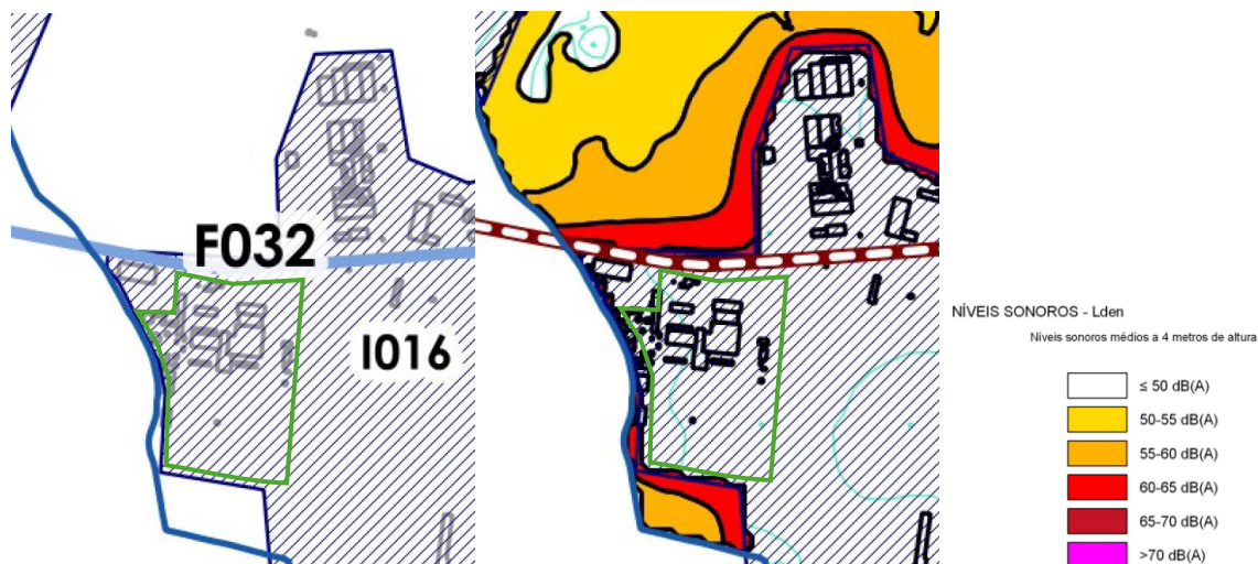
Figura 4 – Delimitação do perímetro da CTCaldeirão nas plantas do Mapa de Ruído do Município da Ribeira Grande e respetiva legenda.

Em suma, os valores presentes no mapa de ruído são similares aos valores registados no relatório de ruído ambiente realizado em 2014 (Relatório de ensaio n.º RER/2014.05 datado de 08/2014), demonstrando que não houve alterações significativas nas condições de emissão sonora da instalação.