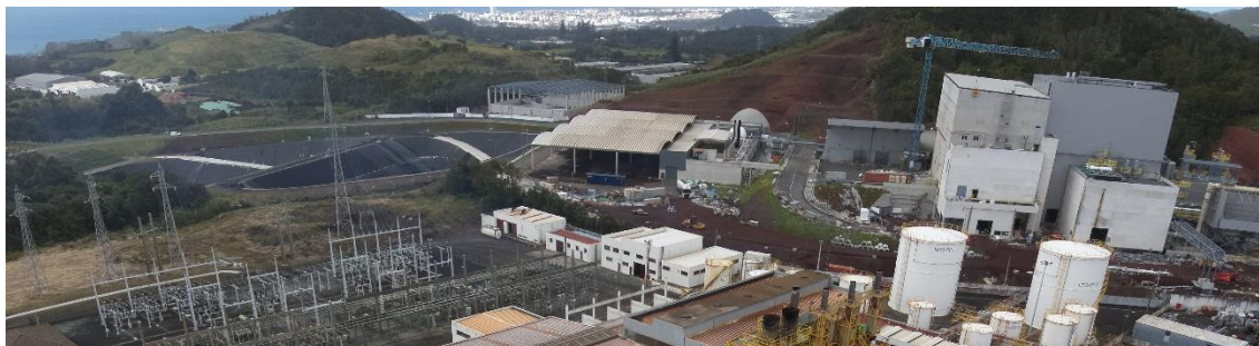
Figura 1 – Novas estruturas afetas ao Ecoparque da MUSAMI, localizadas no terreno vizinho da CTCaldeirão.

De referir que nos terrenos localizados a Este da CTCaldeirão foi igualmente construída a Central de Baterias (BESS) de São Miguel e foi criado um obstáculo de grandes dimensões (monte de bagacina) resultante da colocação da bagacina proveniente da Mata das Feiticeiras, no âmbito do processo de construção do novo estabelecimento prisional de São Miguel.